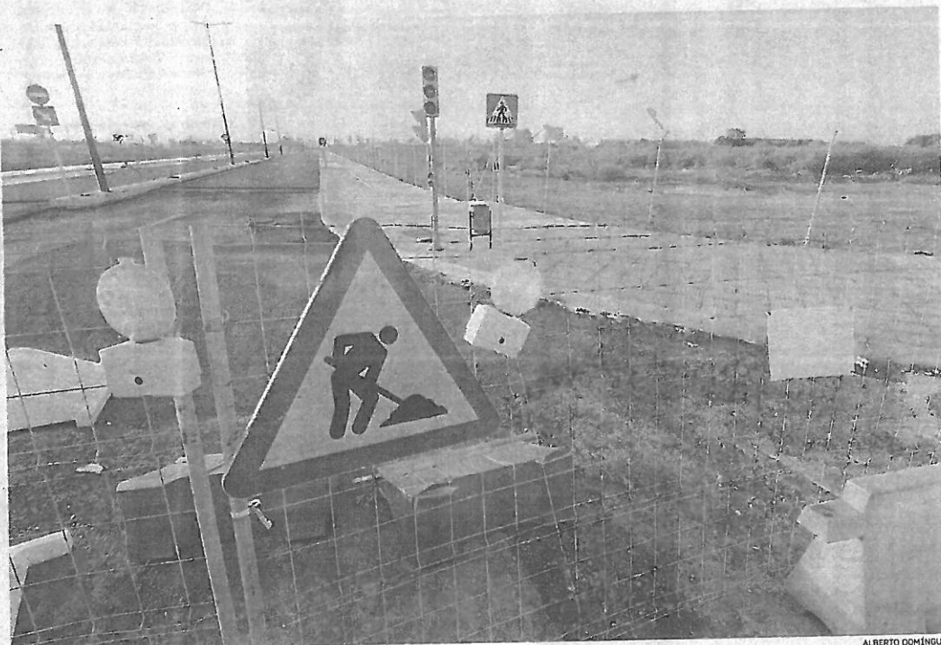
Imagen de los accesos a la futura Zona de Actividades Logísticas del Puerto de Huelva.

Este proyecto está promovido por la Cámara de Comercio de Huelva y está financiado por el Fondo Europeo de Desarrollo Regional (Feder) a través del programa Interreg y la Autoridad Portuaria de Huelva y en las acciones formativas en colaboración con HuelvaPort. El presupuesto total con el que está dotado asciende a 287.500 euros, de